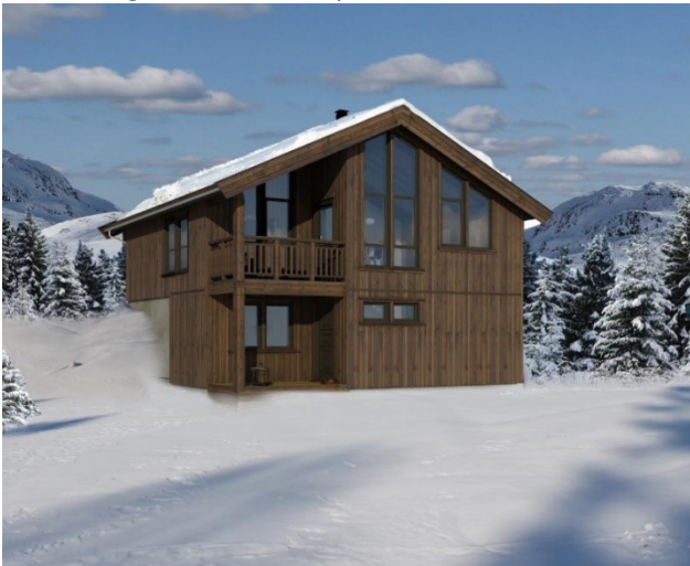
Figur 2 Varden 118

Under følger noen eksempler fra Tinde som kan benyttes innenfor planområdet.