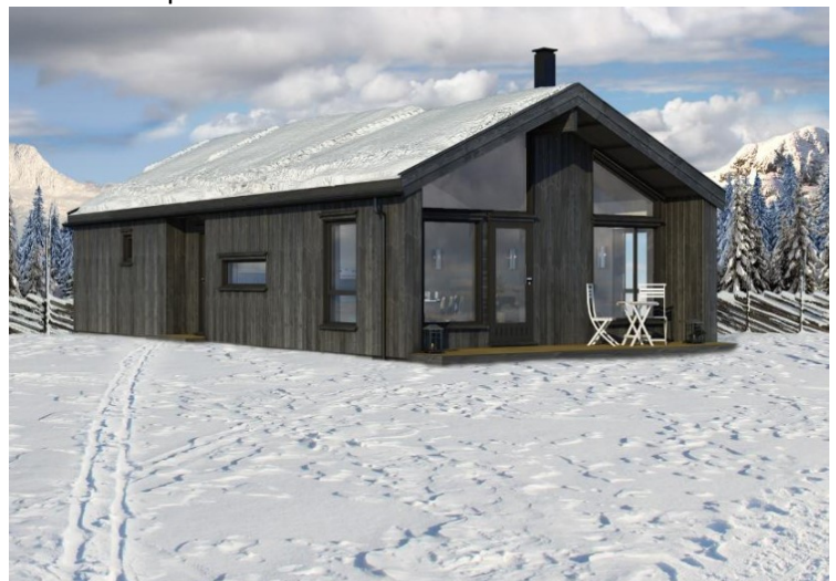
Figur 3 Tid 77