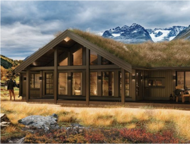
Figur 4 Rå 142