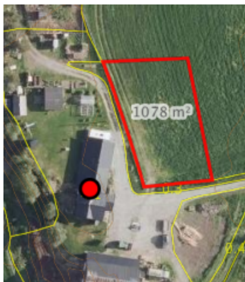
Kart laget av saksbehandler